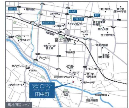
(カーナビは富士宮市田中町272-1(ファミリーマート富士宮田中町店)付近と入力ください)